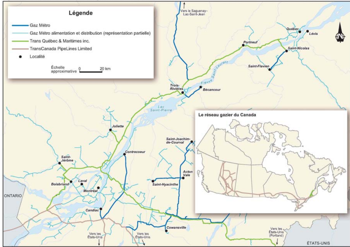
Figure 4 Le réseau de transport du gaz naturel au Québec

Sources : adaptée de la carte Réseau de transport et d'alimentation de gaz naturel au Québec, novembre 2003 [en ligne (19 février 2007) : www.gazmetro.com/data/Media/Carte_Reseau_Gazier.pdf ] ; DA21.15