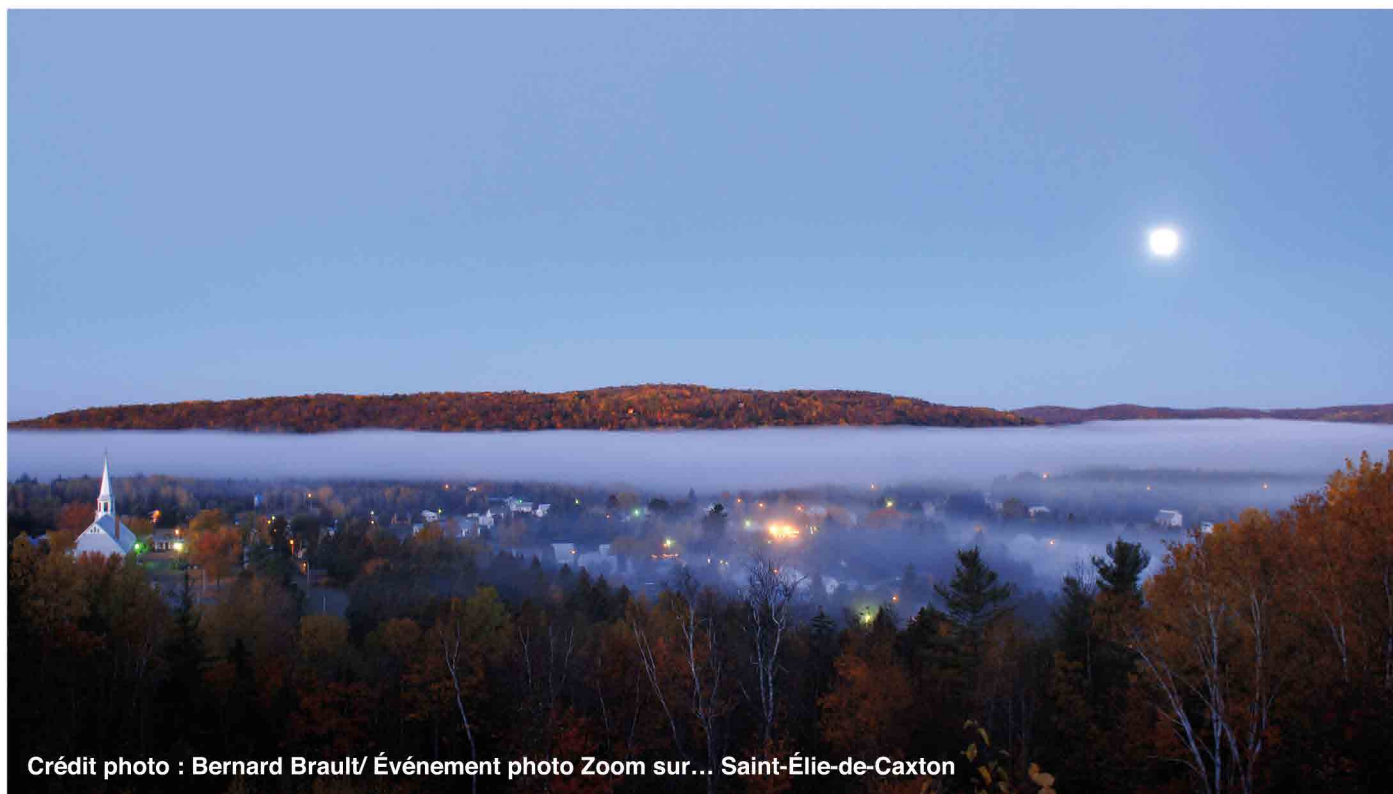
Événement photo Zoom sur... Saint-Élie-de-Caxton

Notre municipalité est dorénavant inscrite dans l'imaginaire québécois. Connue et reconnue grâce à Fred Pellerin, conteur de renommée internationale et chevalier de l'Ordre national du Québec, Saint-Élie-de-Caxton est maintenant un village légendaire. Notre municipalité est portée par une communauté dynamique et impliquée. Bien que notre réputation soit enviable, ce sont nos valeurs de solidarité, de créativité et d'inclusion qui nous distinguent.