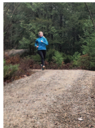
Au Parc nature et culture.

À tous, bravo ! et à la prochaine course amicale du Parc nature et culture, en raquettes, à la course ou à pied.