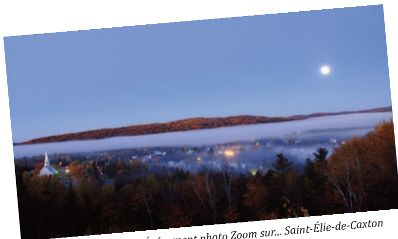
Événement photo Zoom sur... Saint-Élie-de-Caxton