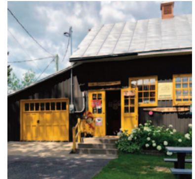
Boutique des Pèlerins

Robert Matteau, Église de Saint-Élie-de-Caxton