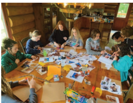
Les jeunes réalisant leur «vision board».

Le camp s'est déroulé sur trois jours, pendant lesquels les jeunes ont reçu plusieurs activités de prévention sur tout ce qui entoure les dépendances. Ainsi, ils ont pu travailler sur les facteurs de protection et à risques aux dépendances (saines habitudes de vie, estime de soi, santé mentale, objectifs personnels, gestion du stress, influence des pairs, etc.), mais aussi apprendre sur les dépendances en général (jeux,