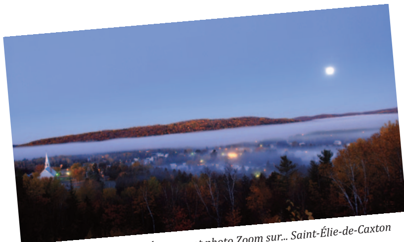
Événement photo Zoom sur... Saint-Élie-de-Caxton