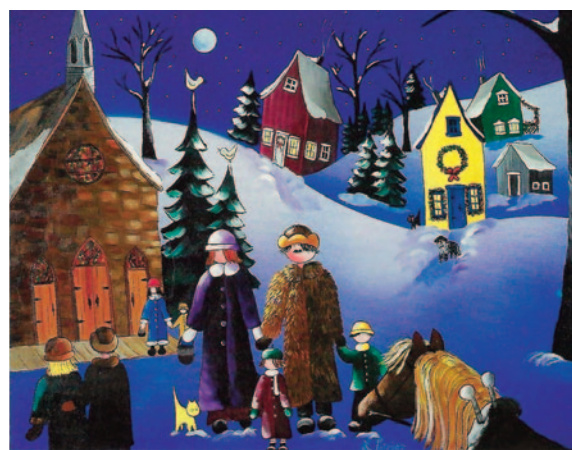
Messe à minuit le 24