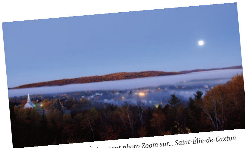
Événement photo Zoom sur... Saint-Élie-de-Caxton