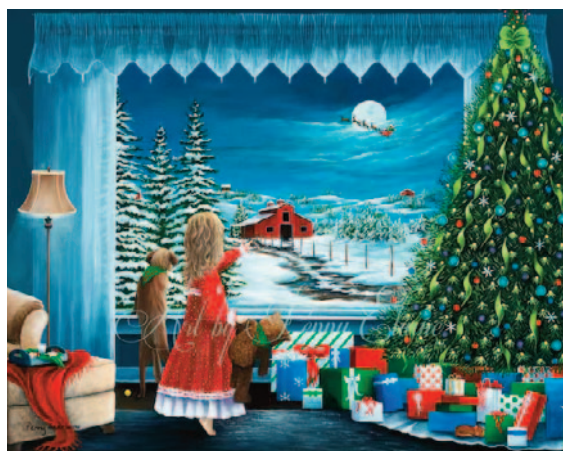
Décorez en toute sécurité Page 6