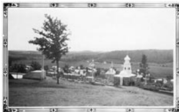
La montagne du calvaire dans les années 1930.