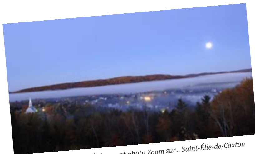
Photo : Bernard Brault / Événement photo Zoom sur... Saint-Élie-de-Caxton