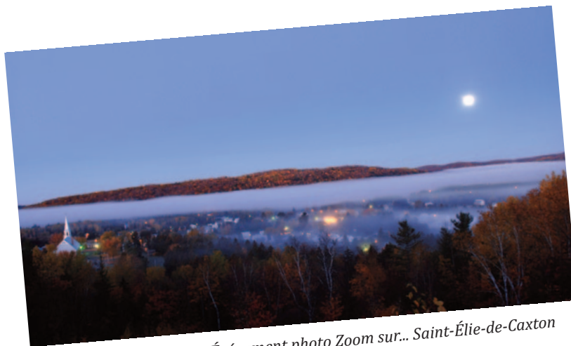
Photo : Bernard Brault / Événement photo Zoom sur... Saint-Élie-de-Caxton