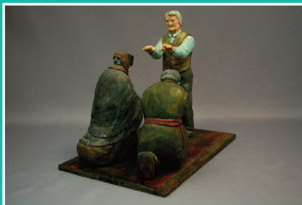
LÉO ARBOUR À L'ÉGLISE Page 13