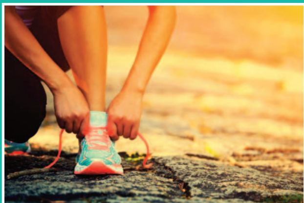
DÉFI DU CALVAIRE Page 4