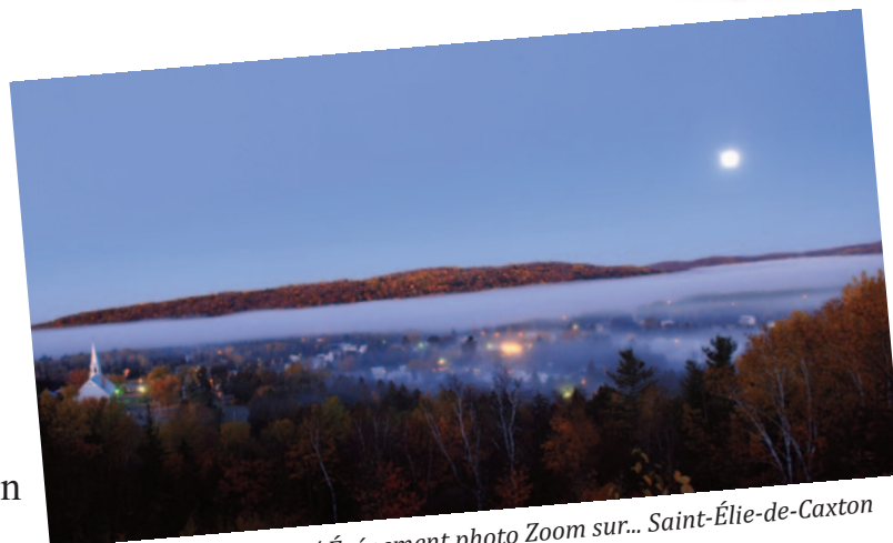
Photo : Bernard Brault / Événement photo Zoom sur... Saint-Élie-de-Caxton