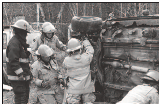
Photographié au garage Claude Auger de Saint-Élie-de-Caxton.