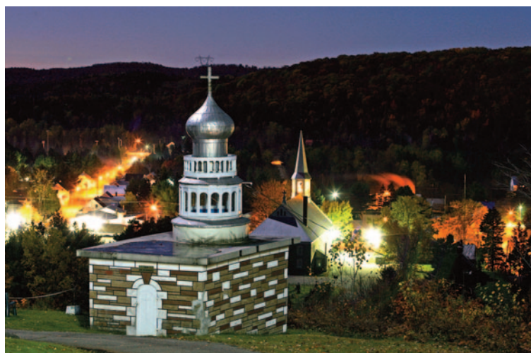
Photo : Olivier Croteau / Événement photo Zoom sur... Saint-Élie-de-Caxton