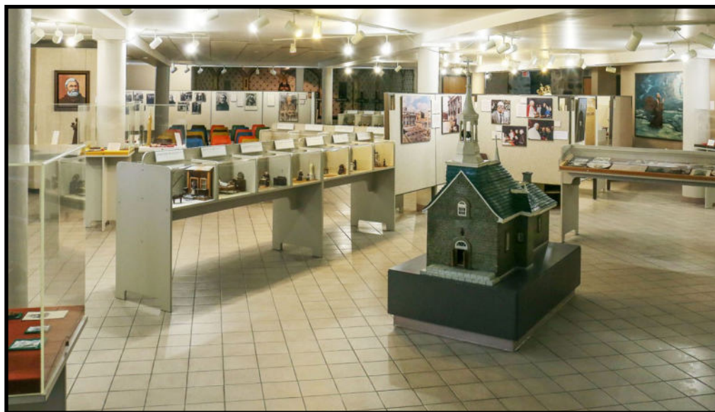
L'exposition sur la vie du bon père Frédéric du temps qu'elle était présentée au sanctuaire musée à Trois-Rivières.