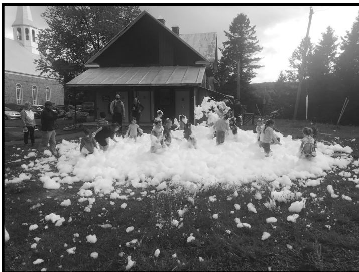
Il était beau de voir les jeunes s'amuser dans la mousse.

devant les performances musicales des artistes invités en soirée. Les enfants ont pu profiter du fameux canon à mousse et s'amuser avec Mélanie, la clowne. Quel bel événement ça été encore une fois ! Un grand merci à tous les participants, aux exposantes et exposants et artistes invités, aux bénévoles, aux élus ainsi qu'aux commanditaires qui ont rendu cette activité possible. À l'année prochaine !